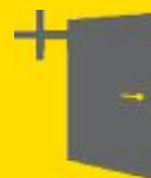
Porta pedonale Stop&Go Pedestrian door Stop&Go Schlupftür Stop&Go